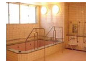
準天然温泉設備「禄寿の湯」