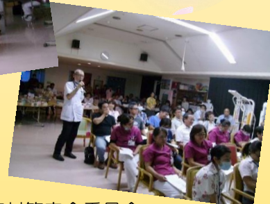
医療対策安全委員会