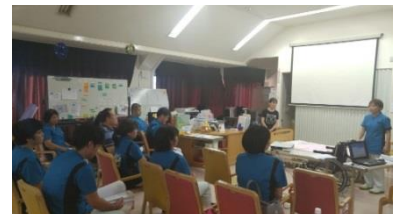
平成28年12月18日に行われた研修・発表会の様子